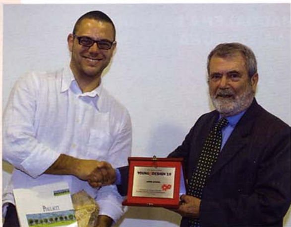
PRIMO PREMIO DIEGO VENCATO Tavolo "Lieve" prodotto da Horm