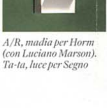
A/R, sedia per Horm (con Luciano Marson). Ta-ta, luce per Segno