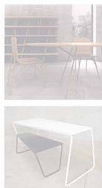
Ipsilon, serie di arredi di acciaio in mostra al Salone Satellite. You & Me, prototipi di ferro e legno