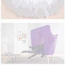
All-a-round, collana in plexiglas tagliato al laser. Our, poltrona prototipo in lycra e acciaio