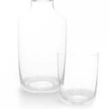
Udon, prototipo di sedia impilabile in acciaio. Whisky, set in cristallo per Lobmeyr