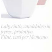
Labyrinth, candelabro in pyrex, prototipo. Flint, vasi per Memento