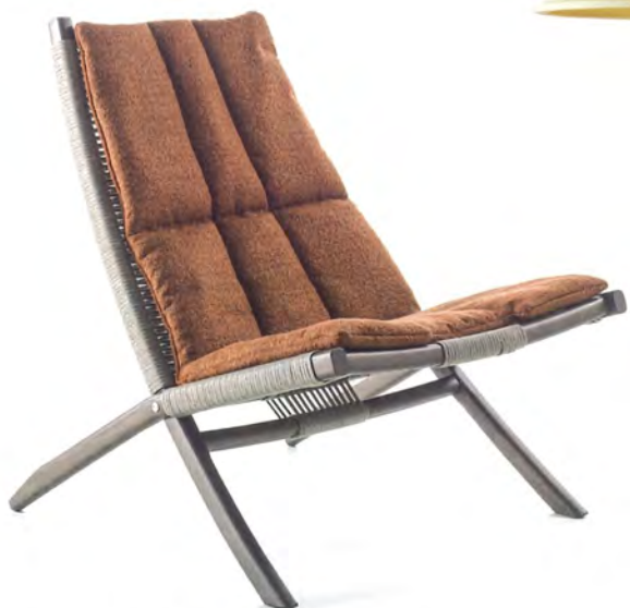
Lässiger Sessel Huli von Frigerio · Entwurf: Federica Biasi