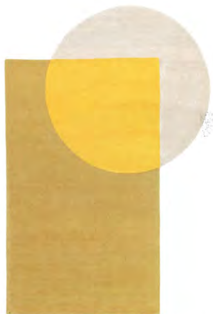
Geometrischer Teppich Teorema von Amini · Entwurf: Elisa Ossino

The resurgent lust for life and warmth that many felt during the days of the trade fair in Milan was also clearly expressed in the furniture designs on display: life-affirming, very earthy and grounded shades of red and ochre radiating optimism, joy and serenity without being any obtrusive. The renewed comeback of the sun colour yellow - the colour of the year 2021 - was an expression of regained vitality. Numerous manufacturers relied on closed-loop production methods, biodegradable materials or dismantlable furniture along with some soft and circular shapes.