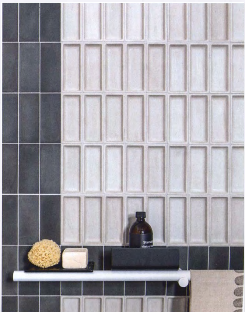
Expressive, dreidimensionale Zementfliese Minimum von Gysum · Entwurf: Marco Merendi & Diego Vencato

Freshly thought mosaic tiles without a grid structure, irritating joint patterns, rediscovered craftsmanship traditions in modern design and three-dimensional surfaces with an expressive depth effect: Even in the still trendy rather subdued tones of nature, earth and grey, strong architectural ceramics turn out to be an exciting planning tool for architects and interior designers, which fits into many design concepts.