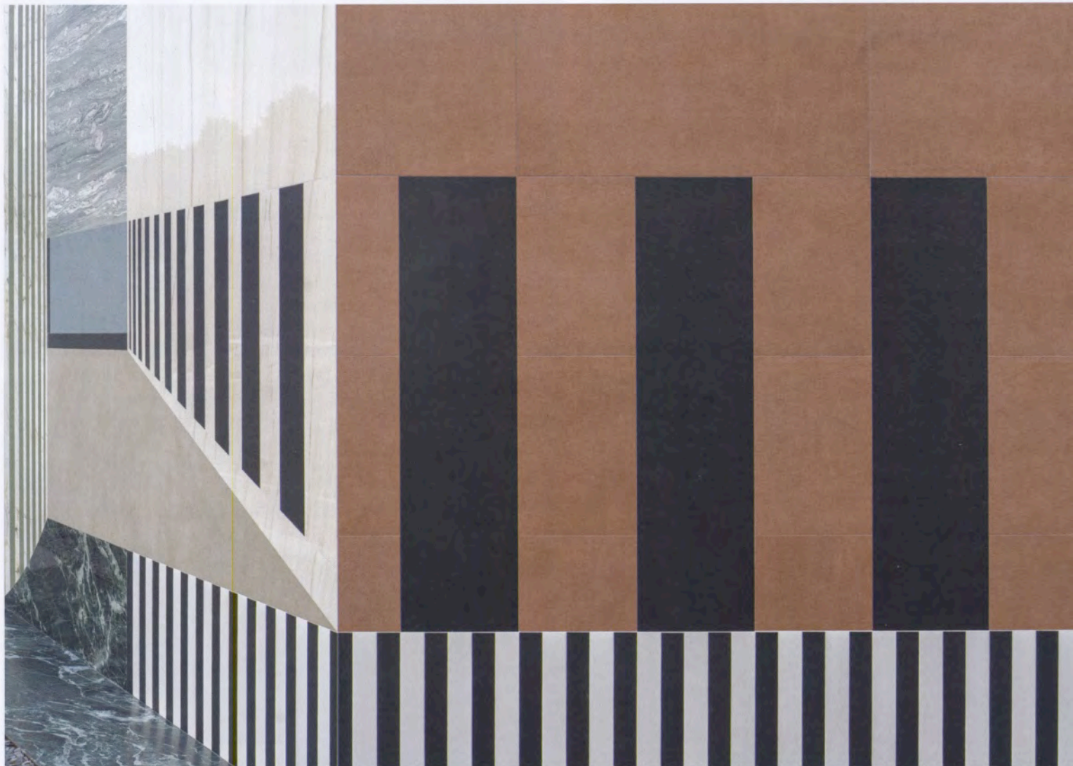
Alles Keramik: Zweidimensionale und perspektivische Wandgestaltung in Sassuolo bei Marazzi , einer Ikone der italienischen Architekturkeramik

TRENDS DER INTERNATIONALEN MESSE FÜR FLIESEN UND FEINSTEINZEUG IN BOLOGNA