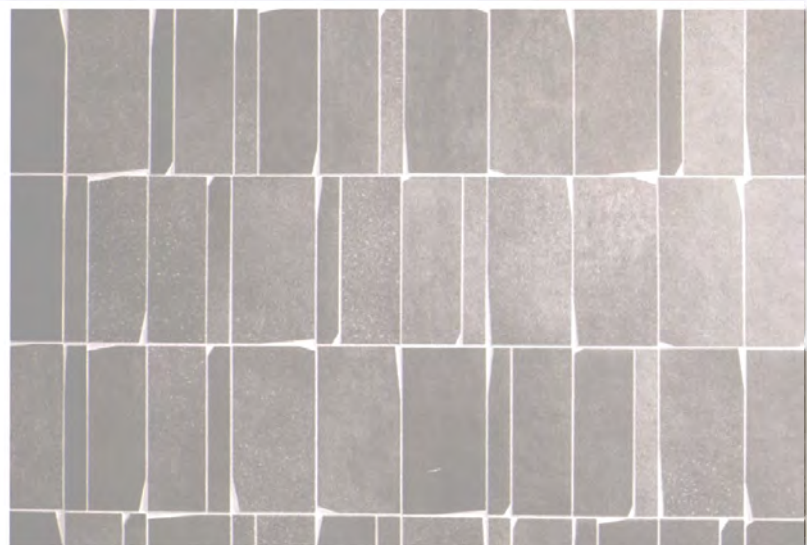
Lenkt den Blick auf die Fugen: Crack von M+ · Entwurf: Lo Studio und Massimo Nadalini