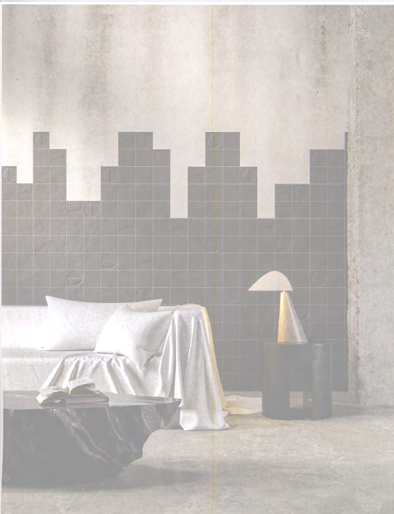
Schwarze Fliesen aus rotem Ton: Bottega d'Arte im Format 15 auf 15 Zentimeter von Iris Ceramica

Freshly thought mosaic tiles without a grid structure, irritating joint patterns, rediscovered craftsmanship traditions in modern design and three-dimensional surfaces with an expressive depth effect: Even in the still trendy rather subdued tones of nature, earth and grey, strong architectural ceramics turn out to be an exciting planning tool for architects and interior designers, which fits into many design concepts.